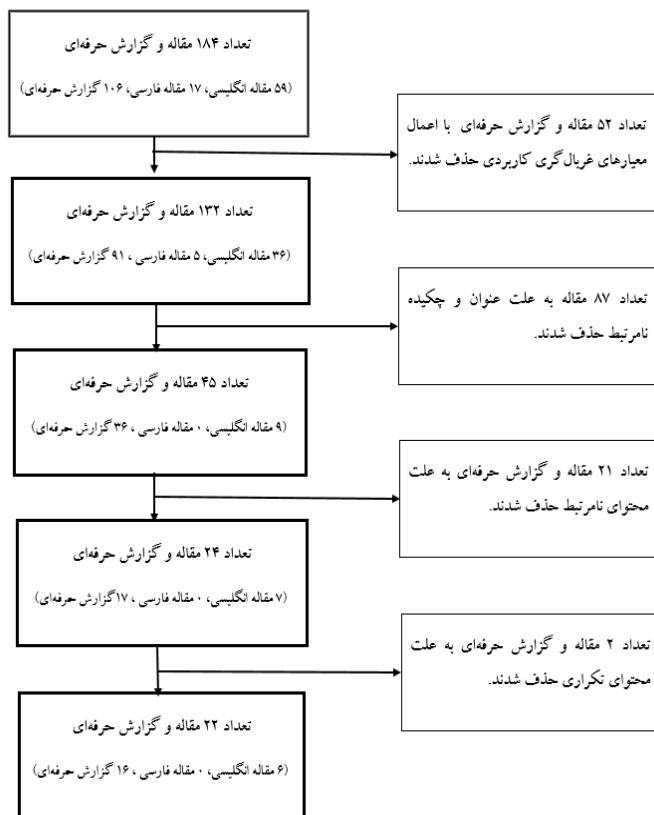
شکل ۱. فرآیند جستجو و انتخاب مقالات مناسب

در شکل ۱ فرایند غربال‌گری مقالات ارائه شده است که پس از چهار مرحله غربال با معیارهای غربال‌گری کاربردی، غربال با بررسی عنوان و چکیده و دو مرحله غربال با بررسی محتوا، ۲۲ مقاله و گزارش حرفه‌ای برای استخراج اطلاعات انتخاب شد که آن‌ها نیز به منظور بررسی کیفیت محتوا، با روش مهارت‌های ارزیابی حیاتی ۱ درجه‌بندی شدند. بر اساس این روش، هر مقاله در ده معیار امتیازی از ۵ را به خود اختصاص داد و به دلیل اینکه همه مقالات امتیاز لازم برای پذیرش (در این مقاله ۵۰) را کسب کردند، هیچ مقاله‌ای حذف نشد.