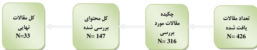
شکل ۱. نتایج جستجو و انتخاب مقاله‌ها

ملاک ورود به متون مناسب، شامل پژوهش‌های چاپ شده مرتبط با مدیریت استعداد بود که اطلاعات کافی را در مورد تحقیق گزارش کرده باشند. ملاک خروج متون نیز هر گونه منبع علمی بی ارتباط با سؤال تحقیق بود. در نهایت، ۲۰۶ مقاله گردآوری شد. با مطالعه عنوان تحقیق، چکیده و محتوای مقاله‌ها مواردی که با موضوع و سؤال تحقیق تناسب نداشتند، حذف شدند. در غربال‌گری مقاله‌ها از ابزار برنامه مهارت‌های ارزیابی حیاتی و نظرسنجی از خبرگان تحقیق استفاده شد، این برنامه شامل ۱۰ سؤال است که این موارد را برای هر مقاله ارزیابی می‌کند: هدف پژوهش، منطق روش، طرح پژوهش، روش نمونه‌گیری، جمع‌آوری داده‌ها، انعکاس‌پذیری، ملاحظات اخلاقی، دقت تجزیه و تحلیل داده‌ها، بیان واضح یافته‌ها و ارزش پژوهش. همان‌طور که در شکل ۱ ملاحظه می‌شود در نهایت ۳۳ مقاله مرتبط با موضوع گردآوری شد.