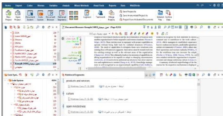
شکل 1. کدگذاری مقالات در نرم افزار مکس کیودا

گام بعدی پس از کدگذاری متون، تحلیل، ترکیب و تلفیق کدها در قالب مضامین پایه است. در این گام، کدهای شناسایی شده بر اساس میزان تشابه مفهومی، دسته‌بندی و ترکیب شده و 117 مضمون پایه استخراج شد. در نهایت، مضامین پایه شناسایی شده بر اساس شهود و درک پژوهشگر از موضوع بررسی شده و با توجه به وجه اشتراک مضامین پایه، در قالب 21 مضمون سازمان دهنده قرار گرفتند. در نهایت، مضامین سازمان دهنده دسته‌بندی شده و در 4 مضمون فراگیر جای گرفتند. در شکل 2 نمایی از مضامین فراگیر، مضامین سازمان دهنده و مضامین پایه در نرم افزار مکس کیودا نشان داده شده است.