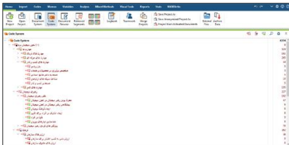
شکل 2. نمایی از مضامین فراگیر، مضامین سازمان دهنده و مضامین پایه در نرم افزار مکس کیودا

گام بعدی پس از کدگذاری متون، تحلیل، ترکیب و تلفیق کدها در قالب مضامین پایه است. در این گام، کدهای شناسایی شده بر اساس میزان تشابه مفهومی، دسته‌بندی و ترکیب شده و 117 مضمون پایه استخراج شد. در نهایت، مضامین پایه شناسایی شده بر اساس شهود و درک پژوهشگر از موضوع بررسی شده و با توجه به وجه اشتراک مضامین پایه، در قالب 21 مضمون سازمان دهنده قرار گرفتند. در نهایت، مضامین سازمان دهنده دسته‌بندی شده و در 4 مضمون فراگیر جای گرفتند. در شکل 2 نمایی از مضامین فراگیر، مضامین سازمان دهنده و مضامین پایه در نرم افزار مکس کیودا نشان داده شده است.