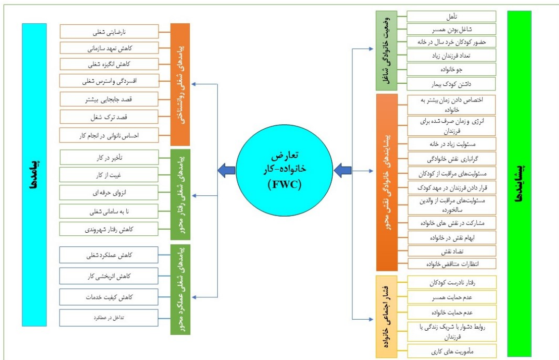
شکل ۲. پیشایندها و پیامدهای تعارض خانواده - کار

در ادامه به تشریح روایتی محتوای این دو شکل در خصوص پیشایندها و پیامدهای دو نوع تعارض کار و خانواده پرداخته می‌شود: