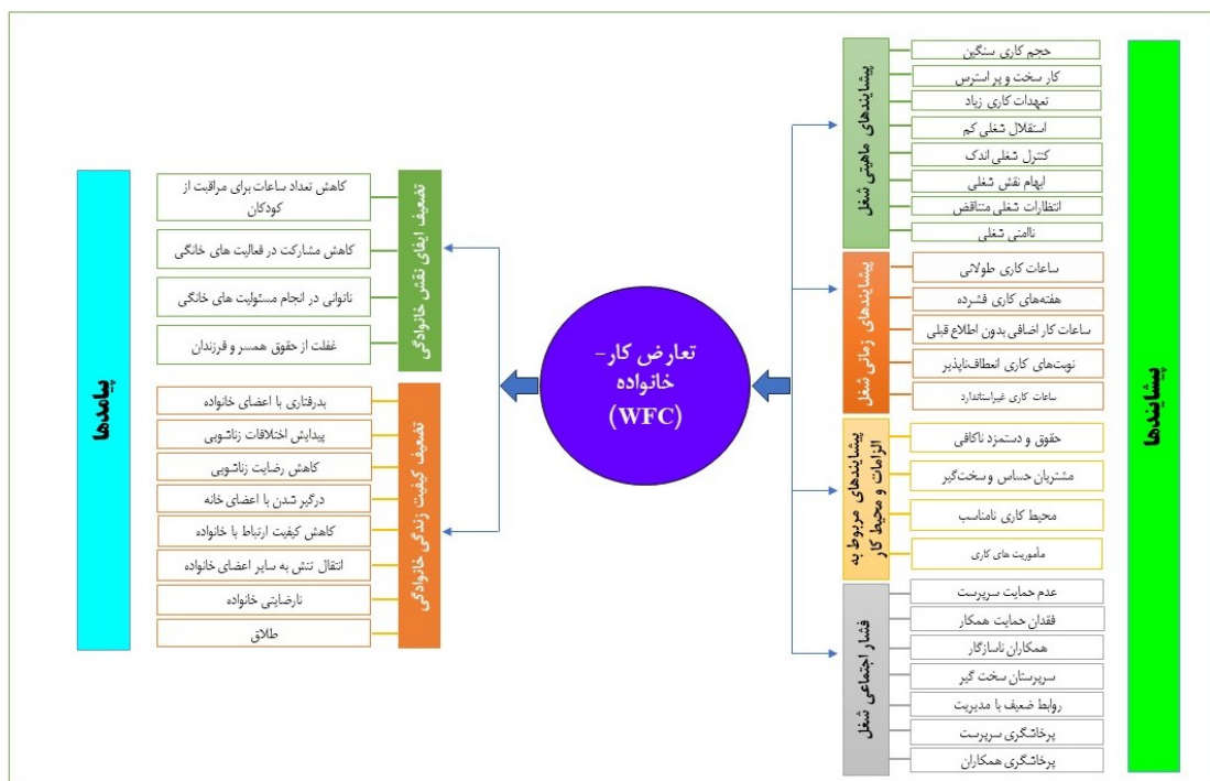
شکل ۱. پیشایندها و پیامدهای تعارض کار - خانواده

در این مرحله، یافته‌های پژوهش به بحث گذاشته می‌شود. به این منظور کدهای اولیه و تلفیق شده مربوط به پیشایندها و پیامدهای هر دو نوع تعارض کار و خانواده (محتوای جدول‌های ۲ تا ۵) در قالب نقشه شماتیک ترسیم شده است. پیشایندها و پیامدهای مرتبط با هر دو نوع تعارض کار - خانواده و خانواده - کار به ترتیب در شکل‌ها ۱ و ۲ ترسیم شده است.