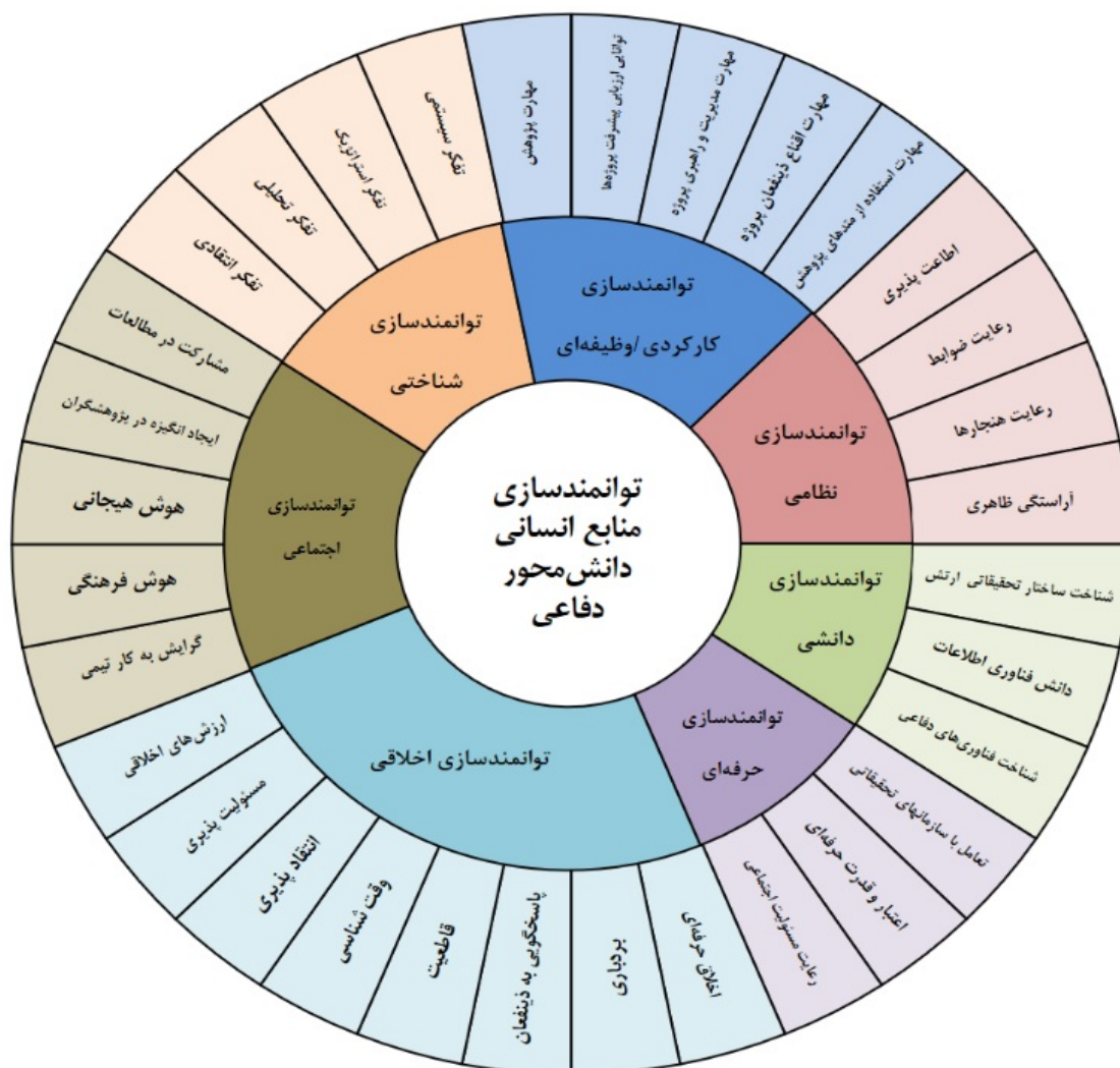
شکل ۱. شبکه مضامین الگوی توانمندسازی منابع انسانی دانشی

جدول ۵ مضامین اصلی الگوی توانمندسازی منابع انسانی دانشی را نشان می‌دهد که از ترکیب این مقوله‌های فرعی، می‌توان مقوله‌های اصلی تشکیل‌دهنده الگو را نشان داد. در شکل ۱ شبکه مضامین مربوط به الگوی توانمندسازی منابع انسانی که از تحلیل تم حاصل شده است.