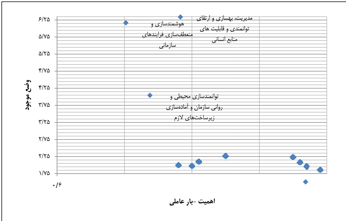
شکل ۳. اولویت‌بندی مضامین فراگیر

با توجه به جدول ۴، می‌توان نتیجه گرفت که انحراف استاندارد و میانگین نمونه، وضعیت خوبی دارد و هر پنج سازه (مضامین فراگیر) با شاخص‌های شان (مضامین سازمان‌دهنده و اساسی) ارتباط معناداری دارند. گفتنی است که مقادیر R Squares برابر با ۰/۷۰۴، میانگین مقادیر معیار Commuality برای تمامی سازه‌ها برابر با ۰/۵۱۶ و مطابق با فرمول برازش کلی مدل، مقدار GoF به‌دست آمده در مدل ۰/۶۰۲ است که این مقادیر، برازش کلی قوی مدل را نشان می‌دهد. در شکل ۳ با استفاده از ماتریس اهمیت - عملکرد، اولویت‌بندی مضامین فراگیر صورت پذیرفته است که نتایج آن در شکل مرقوم شده است.