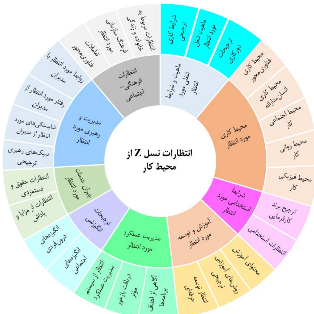
شکل ۲. شبکه مضامین انتظارات نسل Z از محیط کار

در این مرحله، هر یک از مضامین فراگیر، به همراه مضامین سازمان‌دهنده مرتبط با آن، تشریح و تبیین می‌شود. در شکل ۲، انتظارات نسل Z از محیط کار در قالب شبکه مضامین فراگیر و سازمان‌دهنده ترسیم شده است.