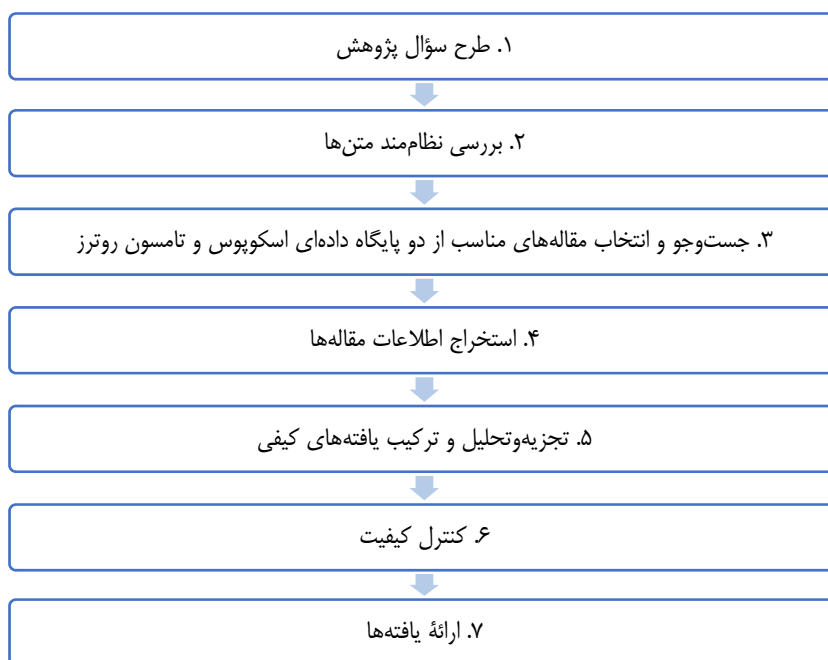
شکل ۱. مراحل انجام فراترکیب

از آنجایی که هدف اصلی این پژوهش، ارائه چارچوب انگیزشی نگهداشت نیروی انسانی متخصص است، از حیث هدف بنیادی و از نظر شیوه جمع‌آوری داده‌ها فراترکیب به‌شمار می‌رود. در پژوهش حاضر تلاش شده است تا با روش فراترکیب و انجام تحلیل محتوای کیفی و با در نظر گرفتن بازه زمانی (برای مطالعات خارجی از سال ۲۰۰۰ به بعد و برای مطالعات داخلی از سال ۱۳۸۰ به بعد) ۱ ، متغیرهای مؤثر بر انگیزش و نگهداشت نیروی انسانی متخصص بررسی شود. فراترکیب یکی از انواع روش‌های فرامطالعه‌ای است که در آن، اطلاعات و یافته‌های مطالعات مختلف با موضوعی مشابه بررسی و تحلیل می‌شود. فراترکیب، تجزیه و تحلیل عمیق کارهای پژوهشی انجام شده در حوزه‌ای خاص است که برای یکپارچه‌سازی تفسیر چندین مطالعه و به‌منظور ارائه یافته‌های جامع و تفسیری به کار می‌رود. رویکرد فراترکیب، نوعی روش تحقیق اکتشافی، برای ایجاد و استخراج چارچوب مشترک از نتایج تحقیقات گذشته است. پیش‌شرط رویکرد فراترکیب، بررسی نظام‌مند ادبیات، به‌منظور شناسایی عوامل مرتبط با هدف پژوهش حاضر است (خلعتبری معظم، یزدانی و عسگری، ۱۴۰۱). در پژوهش حاضر، بر اساس گام‌های اجرای این روش، بررسی نظام‌مند ادبیات با جست‌وجو در دو پایگاه داده‌ای انجام شده است. از میان الگوهای مختلف انجام فراترکیب، در این پژوهش از روش فراترکیب باروسو و سندلوسکی ۲ (۲۰۰۷) استفاده شده که مراحل آن در شکل ۱ آورده شده است.