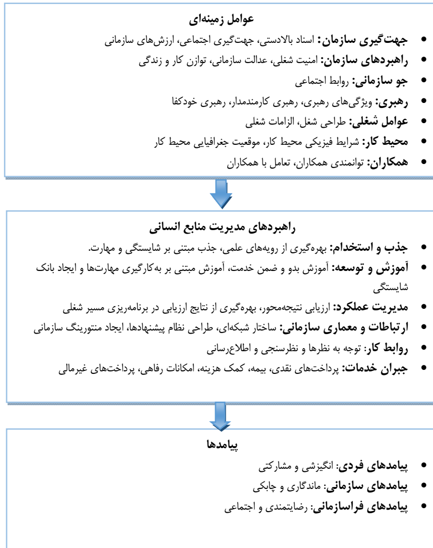
شکل ۳. چارچوب انگیزشی نگهداشت نیروی انسانی متخصص

با توجه به ابعاد شناسایی شده، می‌توان عوامل شناسایی شده را به صورت الگوی زیر طراحی کرد.