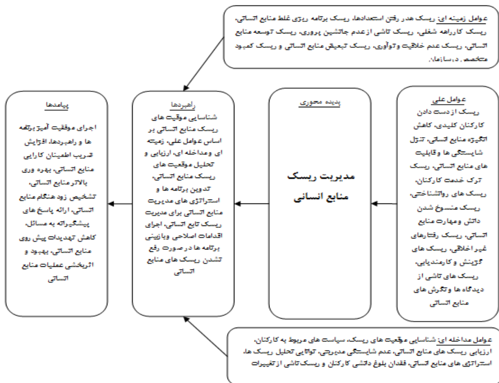
شکل ۲. مدل پژوهش

قضیه چهارم: راهبردهای مدیریت ریسک منابع انسانی عبارتند از: شناسایی موقعیت‌های ریسک منابع انسانی بر اساس عوامل علی، زمینه‌ای و مداخله‌ای، ارزیابی و تحلیل موقعیت‌های ریسک منابع انسانی، تدوین برنامه‌ها و استراتژی‌های مدیریت منابع انسانی برای مدیریت ریسک منابع انسانی، اجرای اقدامات اصلاحی و بازبینی برنامه‌ها در صورت برطرف نشدن ریسک‌های منابع انسانی. قضیه پنجم: اجرای موفقیت آمیز برنامه‌ها و راهبردها، افزایش ضریب اطمینان کارایی منابع انسانی، بهره‌وری بالاتر منابع انسانی، تشخیص زود هنگام منابع انسانی، ارائه پاسخ‌های پیشگیرانه به مسائل، کاهش تهدیدات پیش روی منابع انسانی، بهبود و اثربخشی عملیات منابع انسانی پیامدهای اصلی مدیریت ریسک منابع انسانی هستند. با توجه به مطالب پیش گفته، مدل نهایی پژوهش با استفاده از رویکرد نظریه داده بنیاد به شرح زیر است.